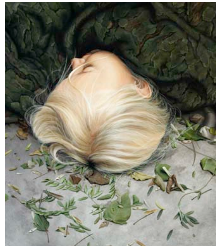
»WAS KÖNNEN WIR WISSEN, WAS SOLLEN WIR TUN?«